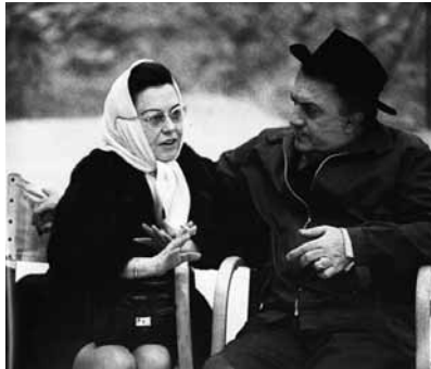
Federico Fellini (Rimini 20 gennaio 1920 Roma 31 ottobre 1993)

E' giudizio ormai unanime che se Charlie Chaplin ha improntato con il suo talento la prima parte del Novecento, la seconda metà è stata profondamente dominata dalla personalità del regista romagnolo Federico Fellini. Valutazione introdotta per la prima volta dalla rivista statunitense Variety, la bibbia dei cineasti, all'indomani dell'attribuzione dell'Honorary Academy Award (il Premio Oscar alla carriera) assegnato dopo altre quattro statuette d'oro ottenute da Fellini per altrettanti film leggendari ( La Strada , Le notti di Cabiria , 8½ , Amarcord ). Apoteosi di un artista unico al mondo, amato all'estero forse ancor più che a casa propria. Il solo italiano, vale la pena ricordare, che la BBC, la televisione pubblica inglese, allo scadere del secolo scorso ha inserito nella centuria delle personalità eccezionali da affidare alla memoria del nuovo millennio.