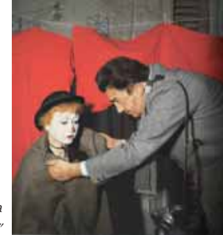
Giulietta Masina "La Strada"