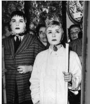
Giulietta Masina "Le Notti di Cabiria"

Comincia così la mia curiosità intellettuale per Fellini, un Capricorno, ma secondo me sconfinato nell'Acquario, anche il mio segno. "Spesso le cose interessanti sono le più folli" diceva lui ! Egli ha dedicato tutta la sua vita a rincorrere i suoi sogni , a portare sul set cinematografico il suo inconscio ricco di fantasia e tormenti. Ed allora i suoi 23 film in quarant'anni di carriera hanno tutti un unico filo conduttore : i sogni di fellini, la psiche di fellini la debolezza dell'uomo.. che si rafforza solo attraverso i racconti .... che tentano di interpretare i protagonisti attraverso la proiezione di se stesso. Dunque un Fellini unico mattatore che non avrà mai più un allievo nella storia della cinematografia mondiale perché unica copia di se stesso. Il transfer psicologico ottenuto attraverso la realizzazione dei suoi capolavori lo ha equilibrato nella vita reale , ed è per questo che Fellini ha trascorso gran parte della sua vita sul set cinematografico: