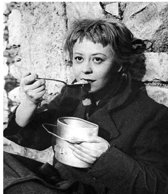
Giulietta Masina "La Strada"