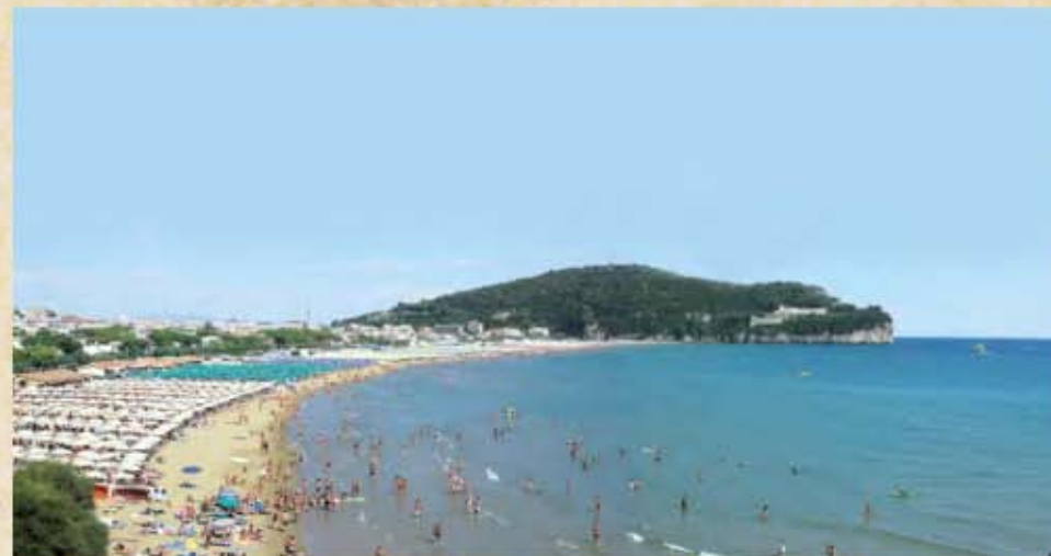
Spiaggia di Serapo

ed attualmente ingrediente principale per gli chef di tutto il mondo. Da ricordare inoltre la Tiella, originale pizza ripiena di pesce o verdure, le cozze, le alici sottosale e tutti i prodotti della pesca, i pomodori spagnoletta e la grande varietà di dolci natalizi. Allo stesso modo una posizione di rilievo è occupata dalla cantieristica navale: infatti la lunga tradizione marinara ha determinato la nascita di numerose aziende di costruzione di yacht e motoscafi conosciute a livello internazionale. Da visitare il promontorio di Monte Orlando, un vero gioiello di 171 metri a picco sul mare con le sue spettacolari falesie calcaree ed un interessante patrimonio flora-faunistico; la Montagna Spaccata con la Grotta del Turco, suggestiva fenditura che si sarebbe formata alla morte di Cristo: secondo una leggenda popolare un miscredente, di fronte all'evento miracoloso, aveva voluto saggiare la consistenza della roccia con la mano, lasciando l'impronta. Le peculiarità del territorio ben si prestano a sport come vela, surf e windsurf, mountain-bike e free-climbing, oltre ovviamente ad un turismo balneare molto apprezzato: in particolare la costa occidentale, dalla spiaggia di Serapo all'altra di Sant'Agostino, formata da piccoli promontori verdeggianti "vigilati" da torri di avvistamento (sec.XVI) che alternandosi con insenature sabbiose fanno di questo litorale uno dei più ameni di tutto il Tirreno.